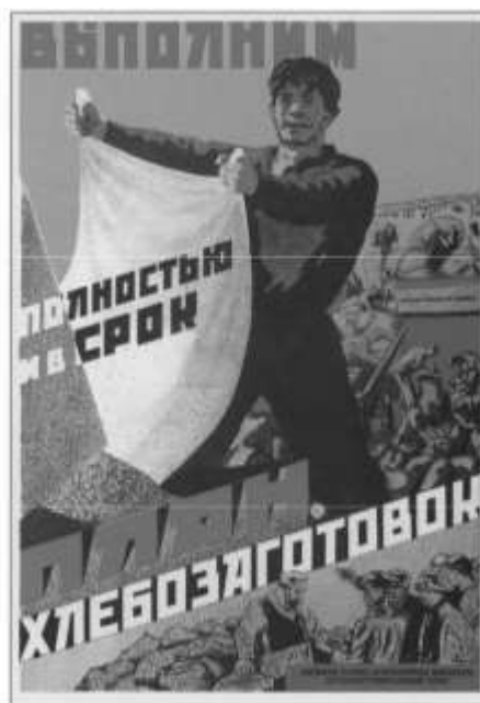
383. Побанов [А.] Выполним полностью и в срок план хлебозаготовок. 1930